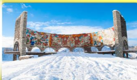
อนุสรณ์สถานรัสเซีย