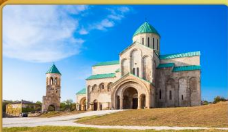
มหาวิหารบาทรากติ