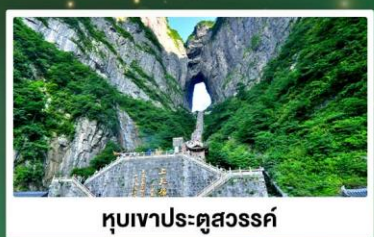
ทิวเขาประตูสวรรค์

🚌 นั่งรถรางแม่หลีก ชมวิวเมืองเฟิ่งหวง 1 ชม