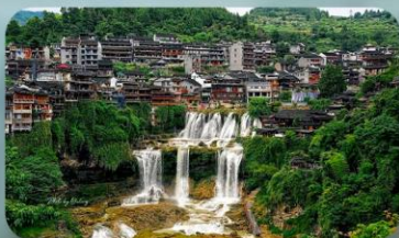
หมู่บ้านฟุหลงเจิ้น