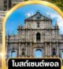
โบสถ์เซนต์ฟอล