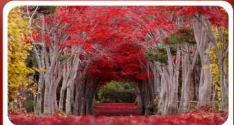
สวนลับฮิราโอกะ