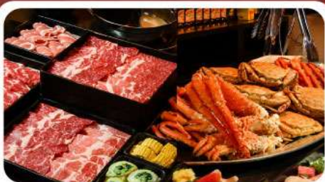
บุฟเฟ่ต์ซาบู ซาปู 3 ชนิด