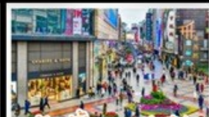
ซ้อบั้งถนนชุนชู่