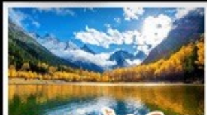
อุทยานป่าแดงโก้ว