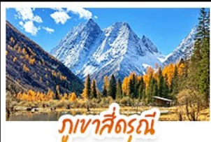
ภูเขาสี่ฤดู

ชมทะเลสาบสีฟ้ามรกต ณ จิวจ้ายโกว • เข็กอิน "ภูเขาสี่ฤดู" สัมผัสความงดงามของใบไม้เปลี่ยนสี ชมทิวทัศน์ภูเขาหิมะติดกับผืนป่าสีทอง • ชมถ้ำน้ำสีฟ้ามรกตสุดมหัศจรรย์ ณ อุทยานหวงหลง • ซ้อมบั้งจุใจ ณแม่น้ำกู่หลี่ และถนนคนเดินชุนเซี่ยพิศมย์! นั่งรถไฟความเร็วสูง 1 ไร่ สู่เมืองดังดู