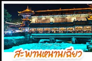
สะพานเทพานเฉียว