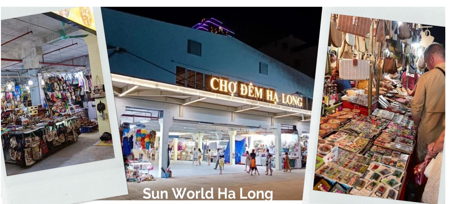
Sun World Ha Long

ค่ำ รับประทานอาหารค่ำ ณ ภัตตาคาร (6) ท่านเข้าสู่ที่พัก AU LAC HOTEL HALONG / NEW ERA HOTEL HALONG ระดับ 4 ดาว (หรือเทียบเท่า)