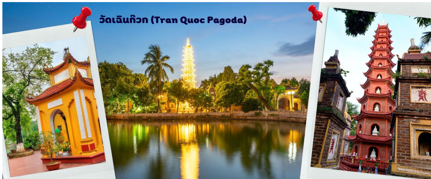
วัดเงินก๊วก (Tran Quoc Pagoda)

เห็นสิ่งปลูกสร้างสไตล์จีน และเจดีย์หลายชั้นโดดเด่น มีภาพที่สะท้อนลงสู่ผืนน้ำ เป็นภูมิทัศน์ที่งดงามทั้งยามกลางวันและยามค่ำคืนที่มีการเปิดไฟส่องสว่าง