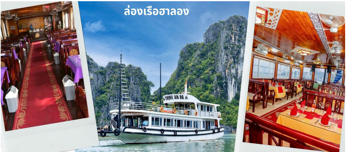
ล่องเรือฮาลอง

เช้า รับประทานอาหารเช้า ณ ห้องอาหารของโรงแรม (7) ท่าน ล่องเรือชมอ่าวฮาลองเบย์ ที่มีพื้นที่กว้างใหญ่กว่า 1,500 ตารางกิโลเมตร อยู่ทางตอนเหนือของเวียดนาม และเป็นส่วนหนึ่งในอ่าวตังเกี๋ย มีชายฝั่งยาวเป็นระยะทางกว่า 120 กิโลเมตร ท่านจะพบกับวิวทิวทัศน์ หันมองไปทางไหนก็สวยงาม เห็นผืนน้ำสีเขียวสวและหมู่เกาะหินปูนน้อยใหญ่โผล่ขึ้นมาจากผิวน้ำทะเลที่มีลักษณะแตกต่างกันออกไป ถือเป็นสถานที่ที่เยี่ยมชมธรรมชาติของเวียดนามอีกแห่งหนึ่งที่สามารถดึงดูดนักท่องเที่ยวมากมายจากทั่วทุกมุมโลกให้มาเยือนสถานที่แห่งนี้