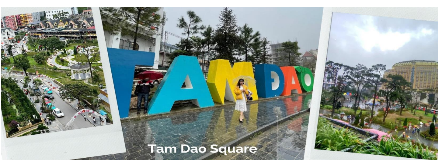
Tam Dao Square

นำท่านถ่ายรูปกับ โบสถ์หินตามด้าว สร้างขึ้นเมื่อปี ค.ศ. 1906 เดิมเป็นบ้านไม้เล็กๆ แต่ต่อมามีการบูรณะปรับปรุงในปี ค.ศ. 1937 ให้มีความแข็งแรง ด้วยการใช้หิน โดยสร้างแบบสถาปัตยกรรมโกธิค และได้รับการอนุรักษ์เอาไว้เป็นอย่างดีจนกลายมาเป็นสถานที่ท่องเที่ยวอย่างในปัจจุบัน ด้านในตกแต่งอย่างเรียบง่ายด้วยหน้าต่างโค้งหลายบาน ประดับด้วยโมเสกแก้วที่เล่าเรื่องราวเกี่ยวกับพระเยซูคริสต์ และเป็นโบสถ์ที่ไม่มีเสาตั้งเด่นอยู่ตรงกลางเหมือนโบสถ์อื่นๆ บริเวณรอบๆ โบสถ์มีพื้นที่ที่สามารถมองเห็นวิวเมือง ตามด้าว ได้ทั้งเมืองเลย