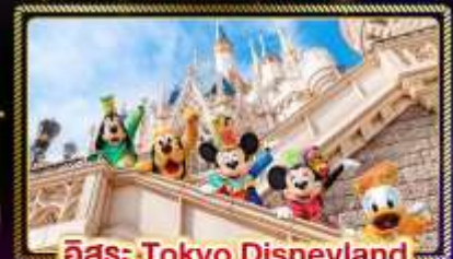
อิสระ Tokyo Disneyland