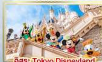
อีสร่: Tokyo Disneyland