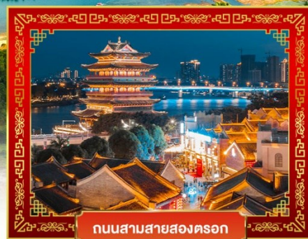
ถนนสามสายสองตอรอก