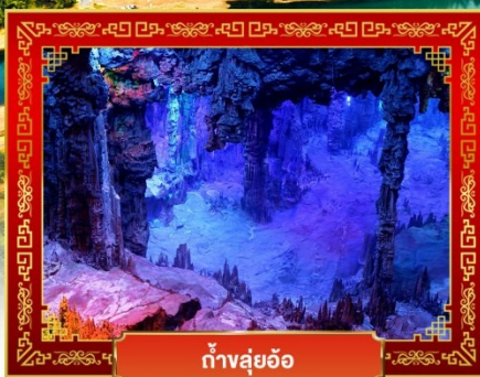
ถ้ำหลุย้อ