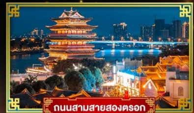
ถนนสามสายสองตรอก