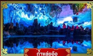
กำลุ่ม้อ

"ดินแดนแห่งสายน้ำและขุนเขา" สัมผัสประสบการณ์นั่งบอลลูนชมวิวมุมสูง