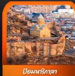
ป้อมนาวิกเวลา