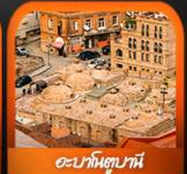
อะบาโนตซุฆานี