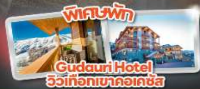
พักรับประทานอาหารค่ำที่โรงแรม Gudauri Hotel วิวที่ทิวเขาคอเคซัส

Tbilisi Gudauri Borjomi Kazbegi Uplistsikhe