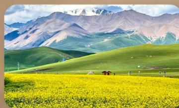
ทุ่งหญ้าซีเหลียน