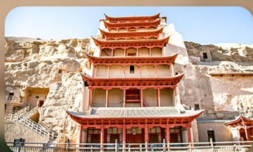
ถ้ำม่อเกาคุ