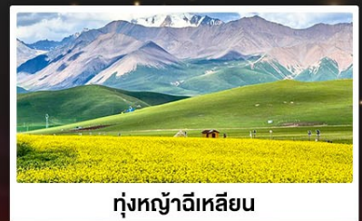
ทุ่งหญ้าอีเหลียน