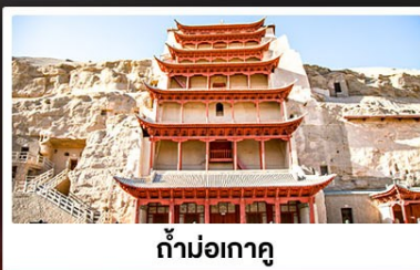
ถ้ำม่อเกาคุ