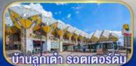
บ้านลูกเต่า รอตเตอร์ดัม

เยือนเมืองเก่าแก่ยุโรป เก็บไฮไลต์กลุ่มประเทศเบเนลักซ์ กับการบินไทย บินตรงอัมสเตอร์ดัม