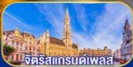
จตุรัสแกรนด์เพลส