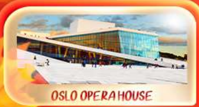
OSLO OPERA HOUSE