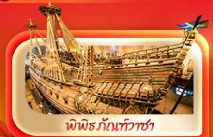
พิพิธภัณฑ์ท้าวชา