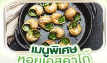
เมนูพิเศษ หอยเอสคาโต