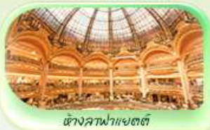
ห้างสรรพสินค้า