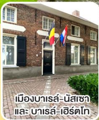
เมืองบารลส์-นัสซาชา และ บารลส์-เฮิร์ตโท