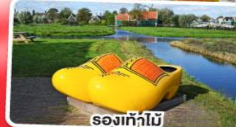
รองเท้าไม้