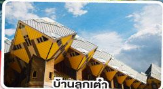
บ้านลูกเต๋าค่า