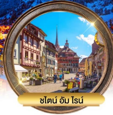
ชไตน์ อัม ไนน์