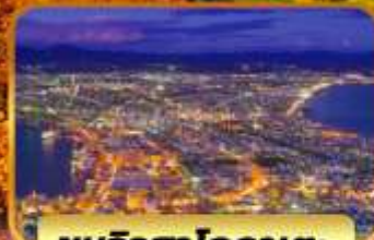
ชมวิวฮาโกดาเตะ