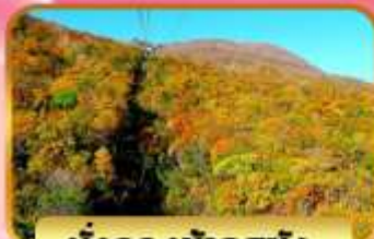
นั่งกระเช้าอุซุซัง