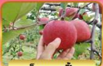
เก็บแอมเบิ้ล