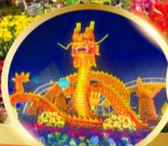
สะพานมังกรพันไฟ