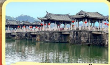
• สะพานโบราณกว้างจี