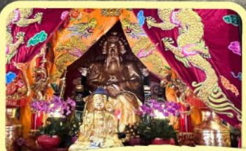
• เอียงบู๊ซิว (ศาลเจ้าพ่อเสือ)