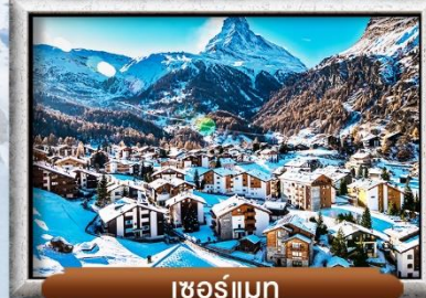
เซอร์แมท

บินทรู สายการบิน Full Service | พิเศษ! ลิ้มลองฟองดู 3 ชนิด