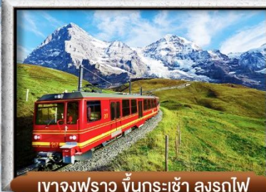
เขาจุงเฟร่า ขึ้นกระเช้า ลงรถไฟ