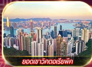
ยอดเขาวัดตอเรียฟัก