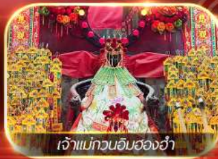
เจ้าแม่ทวนอิมฮ่องฮำ