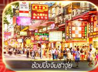
ช้อปปิ้งจิมซาจุย