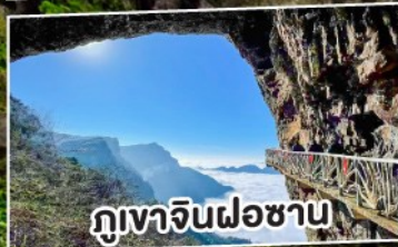
ภูเขาจินฝอซาน