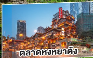
ตลาดหงหยาดัง