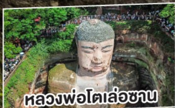
หลวงพ่อโตเล่อซาน