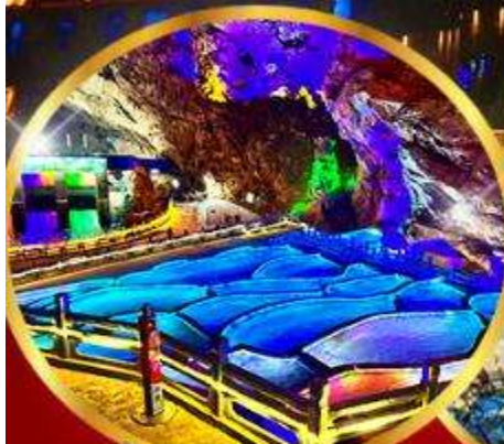
ด่านกนงแอน