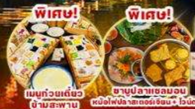
พิเศษ! เมนูถ้วยเต๋ว ข้ามสะพาน