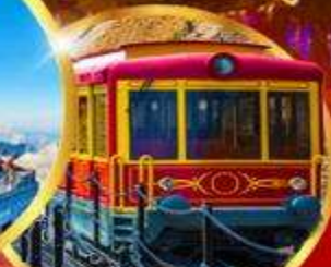
ตรรางซาปา