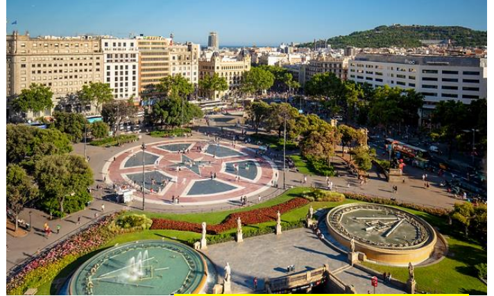
นำท่านเก็บภาพบริเวณด้านหน้า คาซามิล่า (Casa Mila)

Armani , Burberry , Calvin Klein , Coach , Escada , FC Barcelona official store , Gucci , Guess , Hugo Boss , Kipling , L'OCCITANE , Levi's , Lacoste , Loewe , Michael Kors , Nike , POLO , PUMA , Ray-Ban , Samsonite , Superdry , Swarovski , Swatch , TAGHEUER , Tommy Hilfiger , The North Face , Timberland , TUMI , Versace , Zwiliing , Zegna ฯลฯ ได้เวลาพอสมควรนำท่านออกเดินทางสู่ สนามบิน