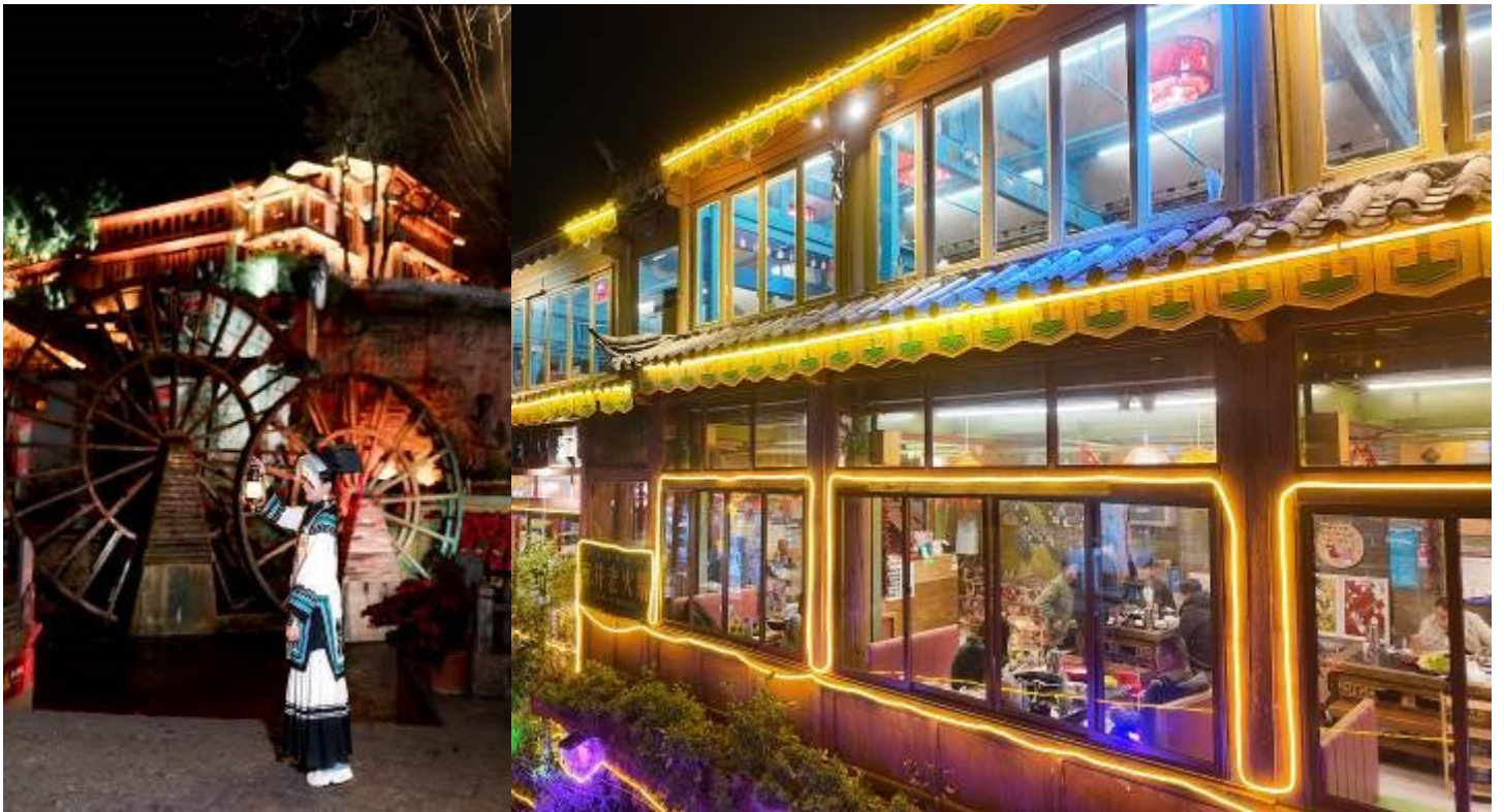
พักที่ JP HYLLIS HOTEL หรือเทียบเท่าระดับ 4 ดาว

จากนั้นนำท่านชม เมืองโบราณลี่เจียง ชมเมืองโบราณของชาวหนานซี มีอายุย้อนหลังไปถึงราชวงศ์หยวนกว่า 800 ปี ได้รับประกาศจากองค์การยูเนสโกให้เป็น “เมืองมรดกโลก”