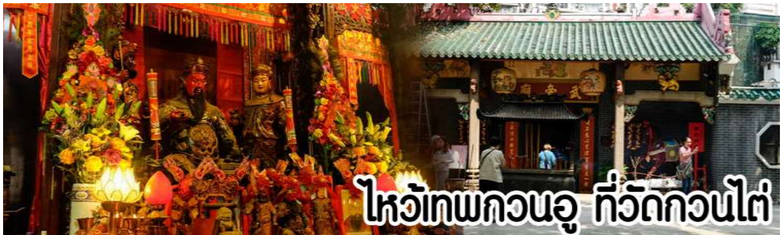
ไหว้เทพกวนอู ที่วัดกวนไต่

หลังจากนั้นขอพรเทพเจ้ากวนอู ณ วัดกวนไต่ วัดเก่าแก่สร้างขึ้นในปีพ.ศ. 2434 เป็นวัดเดียวในเกาะลูนที่บูชาเทพ เจ้ากวนอูเป็นเทพผู้ยิ่งใหญ่ เทพเจ้าแห่งความซื่อสัตย์ โชคลาภ บารมี