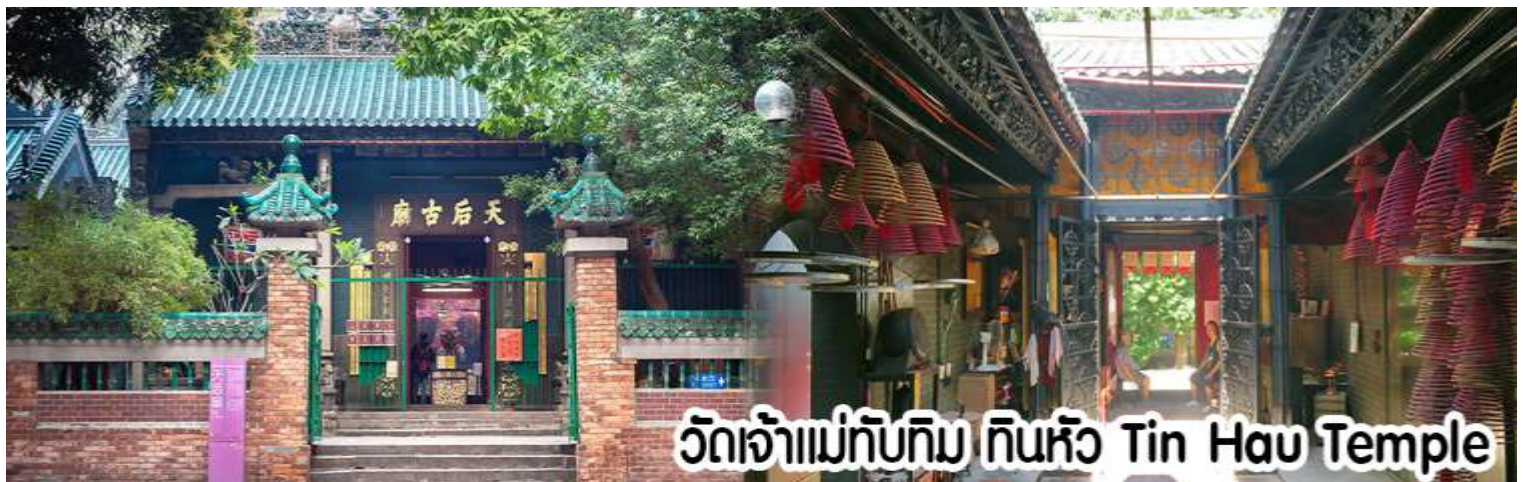
วัดเจ้าแม่ทับทิม ทินฮั่ว Tin Hau Temple

นำทุกท่าน ไหว้ศาลเจ้าแม่ทับทิม ทินฮั่ว (Tin Hau Temple) เป็นวัดเก่าแก่และสำคัญอีกวัดหนึ่งของฮ่องกง เพราะในสมัยก่อนฮ่องกงเป็นเพียงหมู่บ้านชาวประมง ซึ่งเคารพนับถือเจ้าแม่ทับทิมว่าเป็นเทพีแห่งทะเล เพื่อให้เดินทางปลอดภัย เวลาออกไปทำงานไกล ๆ หรือออกหาปลา นอกจากการมาสักการะบูชาเจ้าแม่ทับทิมในเรื่องของการเดินทางให้ปลอดภัยแล้ว ไฮไลท์สำคัญอีกอย่างหนึ่งของ วัดเจ้าแม่ทับทิม ทินฮั่ว (Tin Hau Temple) จะเป็นขดรูปสี่แดงขนาดใหญ่ ที่แขวนอยู่ตามเพดานด้านในวิหารของวัดเต็มไปหมด จะยิ่งสวยงามในยามที่มีแสงแดงส่องลงมาเหมือนเป็นลำแสงส่องทะลุวันรูปแปลกตายิ่งนัก ส่วนอาคารของวัดก็จะเป็นสถาปัตยกรรมแบบวัดจีน สร้างขึ้นตั้งแต่ปีค.ศ. 1876 โดยทางเข้าของวัดจะอยู่ติดกับสวนสาธารณะเล็ก ๆ ที่มีต้นไม้ใหญ่หลายต้น ให้บรรยากาศร่มรื่น