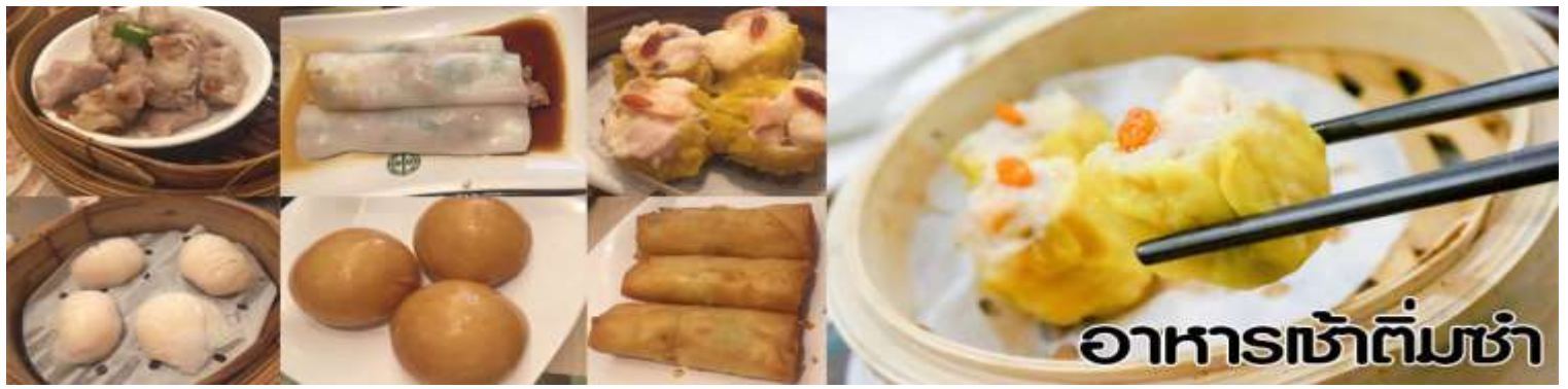
อาหารเช้าทีมซ่า

นำทุกท่าน ไหว้ศาลเจ้าแม่ทับทิม ทินฮั่ว (Tin Hau Temple) เป็นวัดเก่าแก่และสำคัญอีกวัดหนึ่งของฮ่องกง เพราะในสมัยก่อนฮ่องกงเป็นเพียงหมู่บ้านชาวประมง ซึ่งเคารพนับถือเจ้าแม่ทับทิมว่าเป็นเทพีแห่งทะเล เพื่อให้เดินทางปลอดภัย เวลาออกไปทำงานไกล ๆ หรือออกหาปลา นอกจากการมาสักการะบูชาเจ้าแม่ทับทิมในเรื่องของการเดินทางให้ปลอดภัยแล้ว ไฮไลท์สำคัญอีกอย่างหนึ่งของ วัดเจ้าแม่ทับทิม ทินฮั่ว (Tin Hau Temple) จะเป็นขดรูปสี่แดงขนาดใหญ่ ที่แขวนอยู่ตามเพดานด้านในวิหารของวัดเต็มไปหมด จะยิ่งสวยงามในยามที่มีแสงแดงส่องลงมาเหมือนเป็นลำแสงส่องทะลุวันรูปแปลกตายิ่งนัก ส่วนอาคารของวัดก็จะเป็นสถาปัตยกรรมแบบวัดจีน สร้างขึ้นตั้งแต่ปีค.ศ. 1876 โดยทางเข้าของวัดจะอยู่ติดกับสวนสาธารณะเล็ก ๆ ที่มีต้นไม้ใหญ่หลายต้น ให้บรรยากาศร่มรื่น