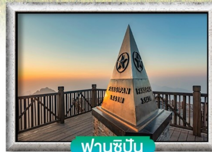
ฟานชีปัน