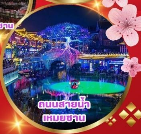
ถนนสายน้ำเหมยซาบ