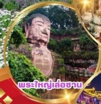
พระใหญ่เส้อซาบ