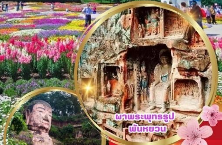
ผาพระพุทธรูปพันหยวน