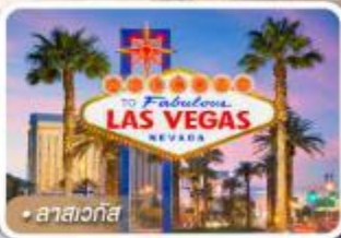
ลาสเวกัส