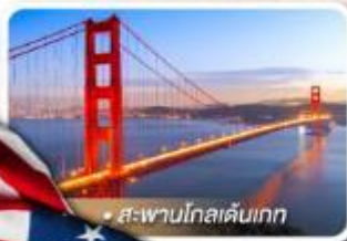
สะพานโกลเดนเกต

★ เยือนอุทยานแกรนด์แคนยอน ฝั่ง South rim ความมหัศจรรย์ทางธรรมชาติ ที่ยิ่งใหญ่ที่สุดแห่งหนึ่งของโลก