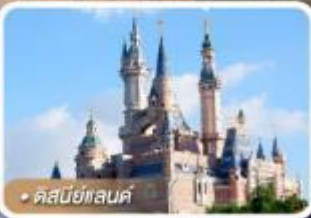
คัสเบย์แลนด์