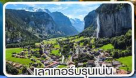
เลาเกอร์บรุนเนน