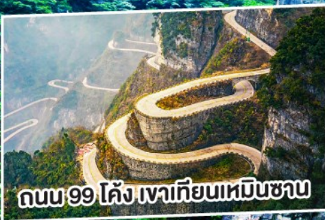
ถนน 99 โค้ง เทียนเหมินซาน