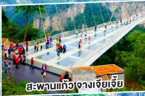
สะพานแก้วจางเจียเจีย