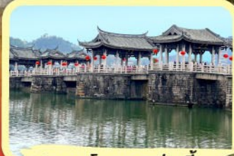
• สะพานโบราณกว้างจี