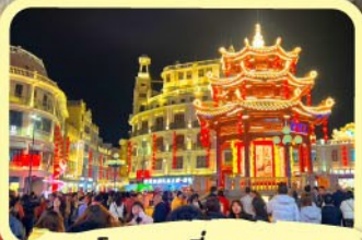
• ถนนโบราณเสี่ยวกงหยวน