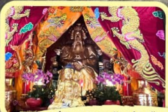
• เอียงบู๊ซิว (ศาลเจ้าพ่อเสือ)