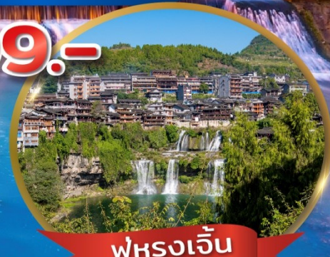
ฟูหรงเจิน