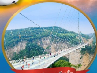
สะพานแก้วจางเจียเจีย