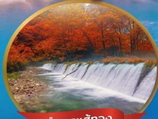
ลำธารแส้ทอง