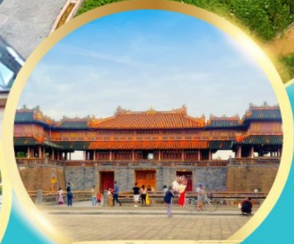
พระราชวังโบราณไคโยย