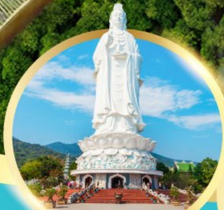
วัดหลังอิง