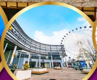
มิตซูเอากะไลท์พาร์ค เซนได