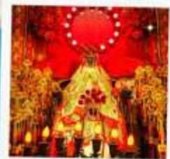
เจ้าแม่กวนอิมสองฮ่ำ