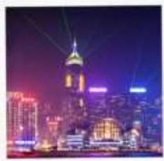
SYMPHONY OF LIGHT