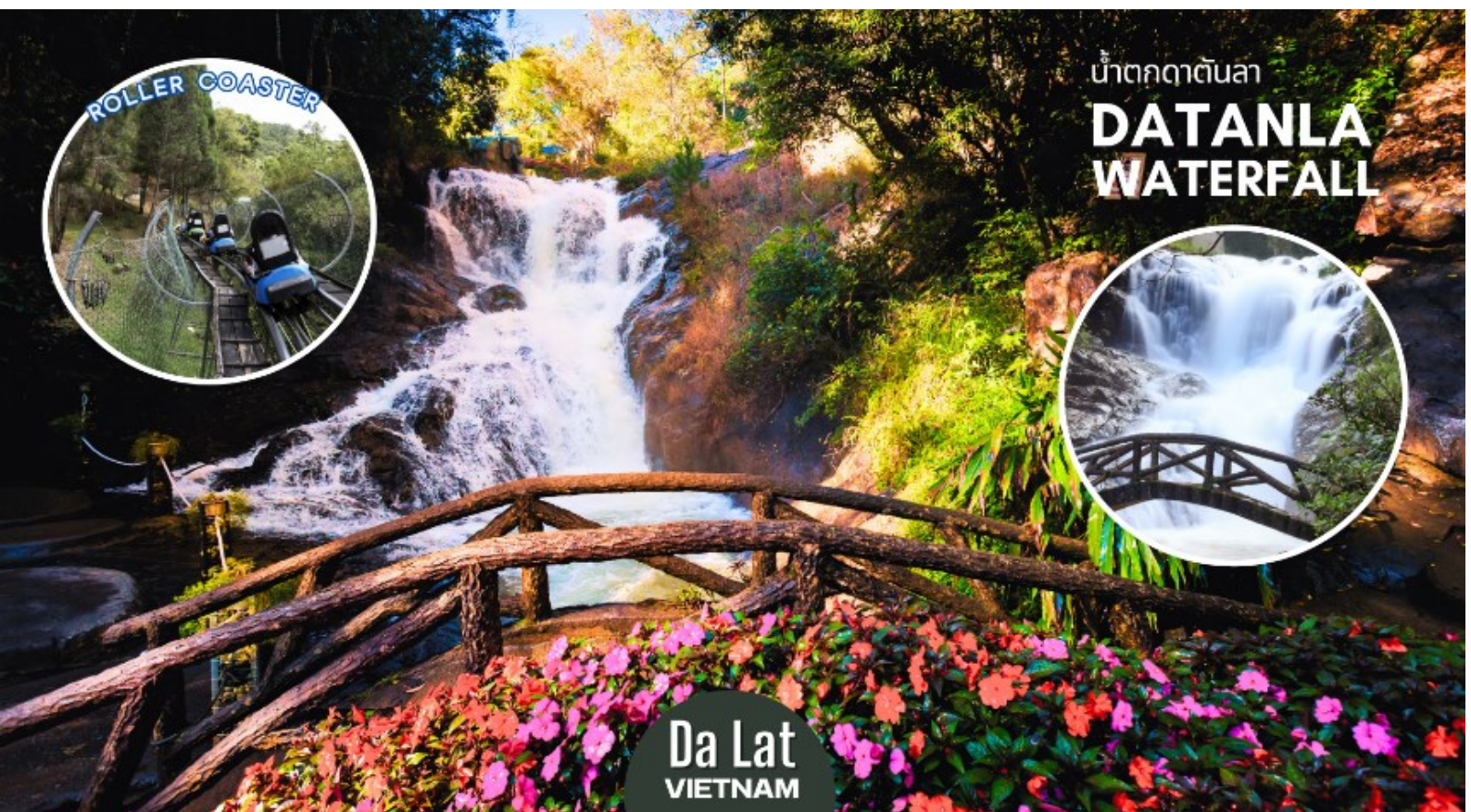
น้ำตกดาตันลา DATANLA WATERFALL

นำท่านสัมผัสประสบการณ์สุดตื่นเต้นโดยการ นั่งรถราง (ROLLER COASTER) ผ่านผืนป่าอันร่มรื่นเขียวชอุ่มลงสู่หุบเขาเบื้องล่าง เพื่อชมและสัมผัสกับความสวยงามของ น้ำตกดาตันลา (DATANLA WATERFALL) อยู่ห่างจากตัวเมืองดาลัดไปทางทิศใต้ประมาณ 5 กิโลเมตร เป็นน้ำตกไม่ใหญ่มากแต่มีความสวยงาม น้ำตกแห่งนี้จะเป็นน้ำตกที่มีนักท่องเที่ยวมาเยือนมากที่สุดและไม่ควรพลาดในการมาเที่ยวชม