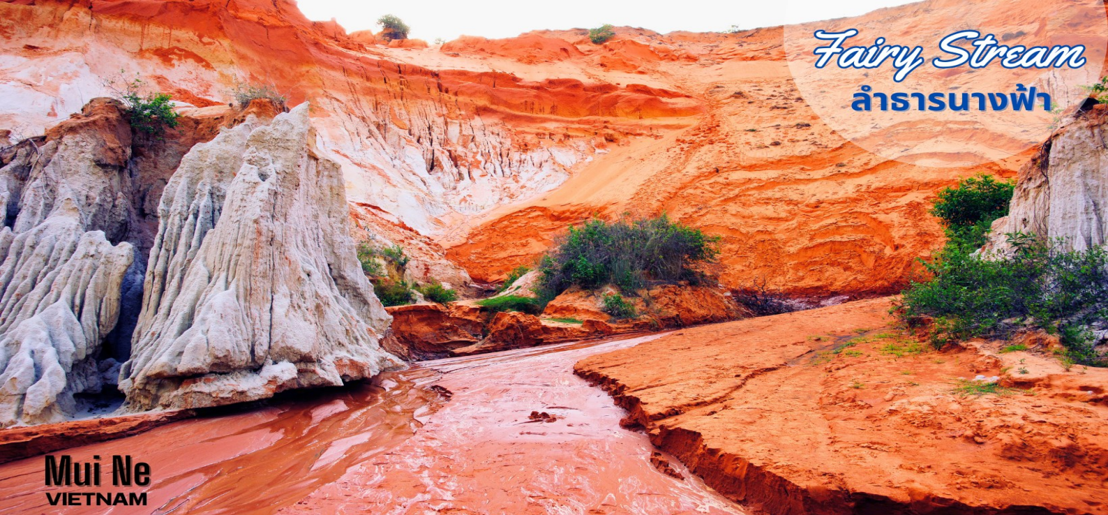
Fairy Stream ลำธารนางฟ้า