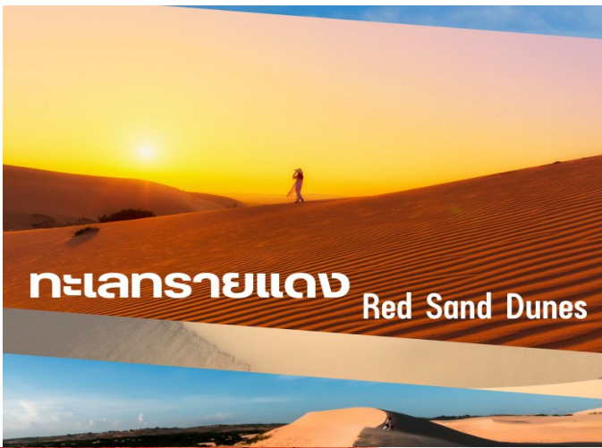
ทะเลทรายแดง Red Sand Dunes