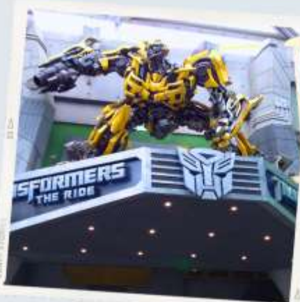
ZONE 1 : HOLLYWOOD