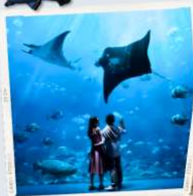
ZONE 7 : FAR FAR AWAY