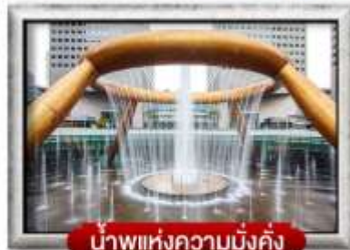
น้ำพุแห่งความมั่งคั่ง