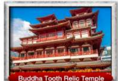
Buddha Tooth Relic Temple