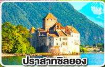
ปราสาทชิลอง