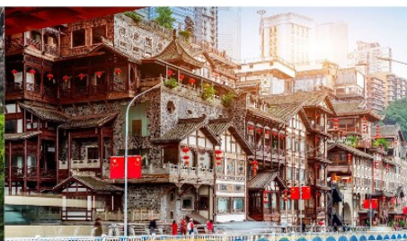
หงหยาดัง