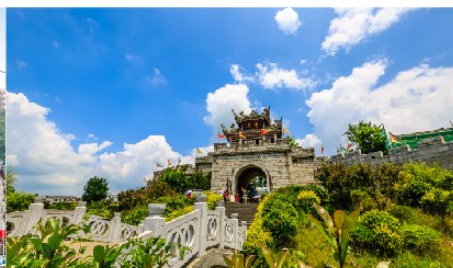
เมืองโบราณซิงหยวน

*ทางบริษัทฯ ขอสงวนสิทธิ์ในการสลับโปรแกรมทัวร์ตามความเหมาะสมขึ้นอยู่กับสถานการณ์หน้างาน โดยคำนึงถึงผลประโยชน์ของลูกค้าเป็นสำคัญ