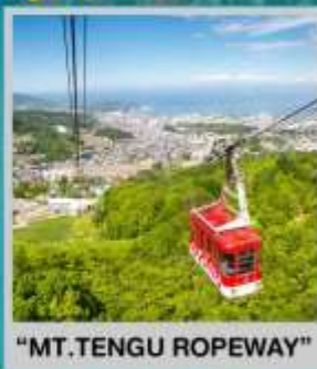
"MT. TENGU ROPEWAY"