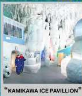
"KAMIKAWA ICE PAVILLION"