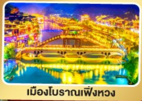
เมืองโบราณฟิงหวง