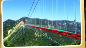
สะพานแวงนอ้ายจ้าย