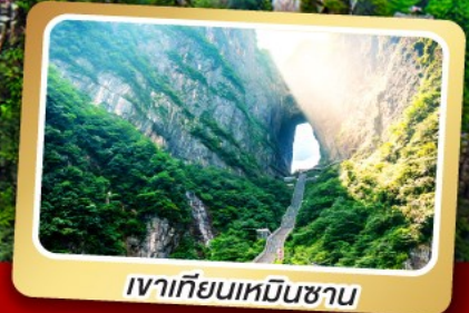
เวาเทียนเหมินซาน

ทริปเดียวเที่ยว 2 เมืองโบราณ ฝูหลงและเฟิ่งหวง