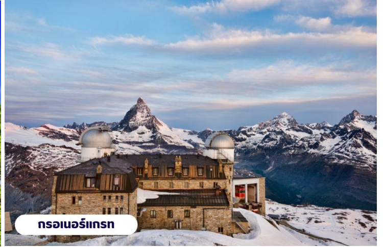
กรอเนอร์กรัท