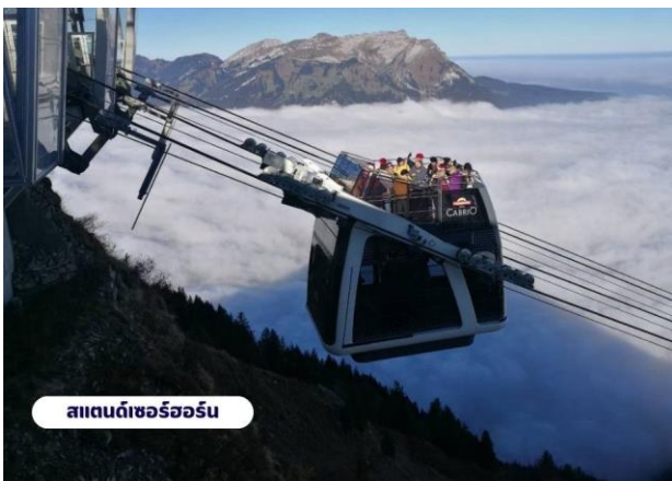
สแตนด์เซอร์ฮอร์น

☉ บริการอาหารเช้า ณ ห้องอาหารของโรงแรม จากนั้นนำท่านเดินทางสู่สถานีกระเช้า เพื่อเตรียมตัวเดินทางขึ้นสู่ ยอดเขาสแตนเซอร์ฮอร์น (Mt.Stanserhorn) มีความสูงที่ 1,898 เมตร(6,227 ฟุต) ระหว่างทางคุณจะได้ชมวิวแบบพาโนรามาและให้ท่านได้สัมผัสการเดินทางโดยขึ้นกระเช้า “Cabrio” กระเช้าลอยฟ้าเปิดประทุนที่มี 2 ชั้นแห่งแรกของโลก และสามารถจุผู้โดยสารได้เกือบ 60 ท่าน โดยขึ้นดาดฟ้าจะสามารถจุได้ 30 ท่าน ระยะเกือบ 2 กิโลเมตร ระหว่างทางขึ้นสู่ยอดเขาท่านจะสามารถมองเห็นวิวแบบ 360 องศา จากนั้นให้ท่านได้เพลิดเพลินกับความสวยงามของธรรมชาติและทัศนียภาพที่งดงาม