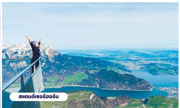
สแตนด์เซอร์ฮอร์น