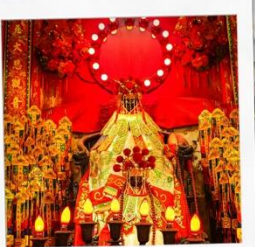
เจ้าแม่กวนอิมสองห้า