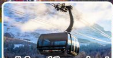
กระเช้า ไอเกอร์เอ็กสเพรส สู่อยอดเขาจุงเฟรา

อิตาลี สวิตเซอร์แลนด์ ฝรั่งเศส 10 วัน 7 คืน