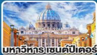
มหาวิหาร เซนต์ปีเตอร์