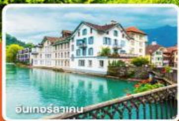
อินเทอร์ลาเคน