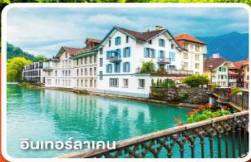
อินเทอร์ลาเคน