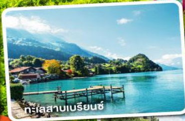
ทะเลสาบเบรียนซ์