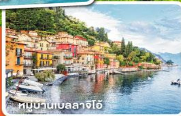
หมู่บ้านเบลลาจีโอ